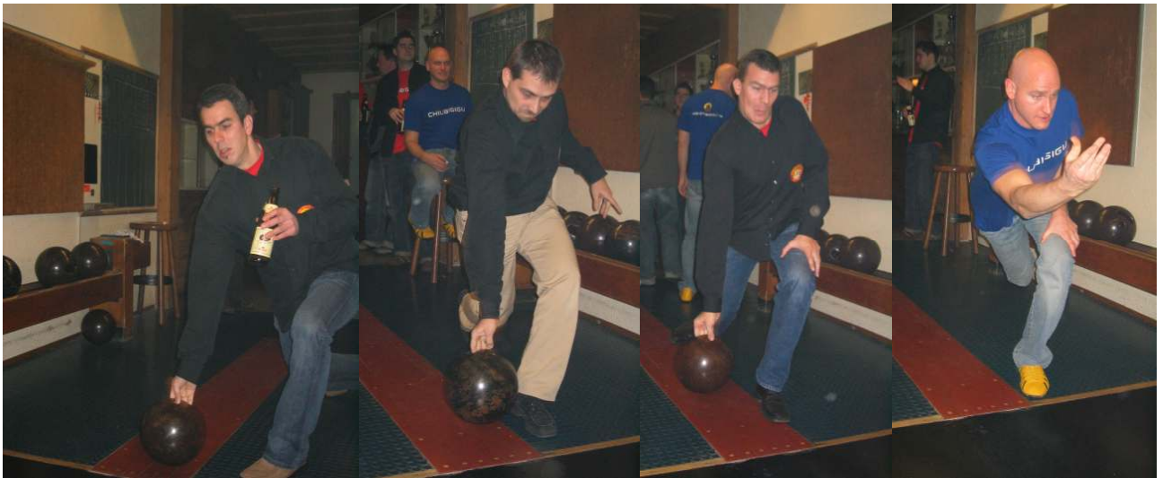
----- Chegley by Chiubigigu -----

Als es endlich Samstag wird, heisst es ab nach Bümpliz ins Restaurant Jäger. Man trifft sich beim Kegeln. Die Einen sind schon früh anwesend und genehmigen sich das längst überfällige Bier, die Anderen sind noch bierlos unterwegs.