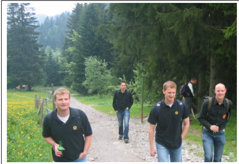
Der gemütliche Aufstieg