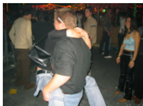
So! göh mir mau hei!