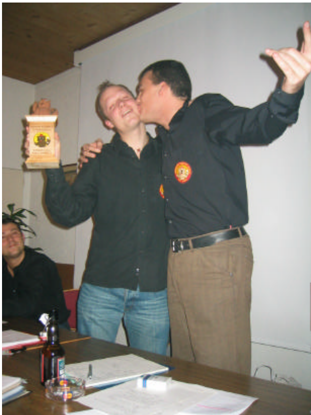
so wärde Chiubigigle geehrt...

Ussert am 24h-Brätle einisch meh e gesunde Mix us Sozial- und Sportevent. Wird auso wieder e bündige Chiubigigu-Summer!