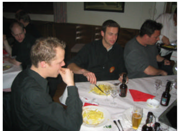
Buuchtest.....du hesch gnue gha.....