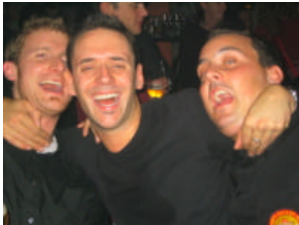
Müür si Bärner Chiubigigle.....müür si Bärner Chiubigigle.....

Ig hoffe, ig heig öich mit dene Zile e chli chönne beschriebe, was abgange isch. Aber e Bricht cha nie wiedergäh, wis isch, „Live“ drbi d'si. U es Fazit vo däm Abe git's säubverständlech o: