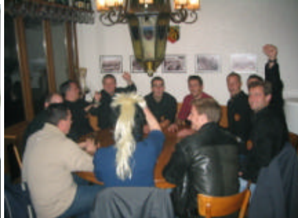
ds Bier söll e mal cho