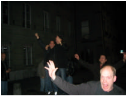
Impressione vom Abe

Irgend einisch i de früeche Morgestunde bi ni du, nid ganz ohni Stouz, heitorklet (ehrlech, ig bi gloffe!!!) u ha dr ganz Sunntig mit mim Hustier, amene Riesekater, (weiss geng no nid wie dä gheisse het u gseh hane sit denn o nüm) verbracht.