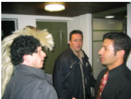
I bruuche es Müntschi

Nöii Beiz, nöis Glück – mit dere Ischtellig hei mer allschliessend schier sämtlechi Beize ir Autstadt abklappert. U o dr Müntschi-Totomat isch langsam aber stetig gstige. Nach Gaschthuus Nr. 7 het's mer du no es chlises Praliné i Form vore churze Asprach inegschneit. Vor e Openair-Kanzlei hani dörfe es paar idringlechi Wort a die versamlet i Chiubigigu-Schar richte. Es hei sogar no paar Passante aghaute gmeint, da gründi eine ä nöii Sekte. (Mir danke a d'Perügge, wo ni geng no ha uf dr Bire gha.) A Propos Perügge – die het me grad aschliessend a mini Red dürne Chlousechappe, wo nid weniger Sexappeal het usgestrahlet, ersetzt. So umgstylet u immer no vouer Elan, hei mer (es isch übrigens scho sunnti gsi) üses Ändziu, ds Restaurant Glogge agstüret. Säubverständlech ungerbroche vo zwe dreine Bier- und Tequila-Degustatione. (Wüu durschtig ir Glogge uftouche cha jitz nüt si).