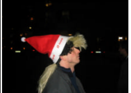
itz no heitorkle

Ig hoffe, ig heig öich mit dene Zile e chli chönne beschriebe, was abgange isch. Aber e Bricht cha nie wiedergäh, wis isch, „Live“ drbi d'si. U es Fazit vo däm Abe git's säubverständlech o: