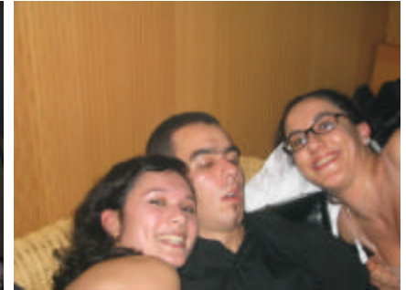
o penne zieht